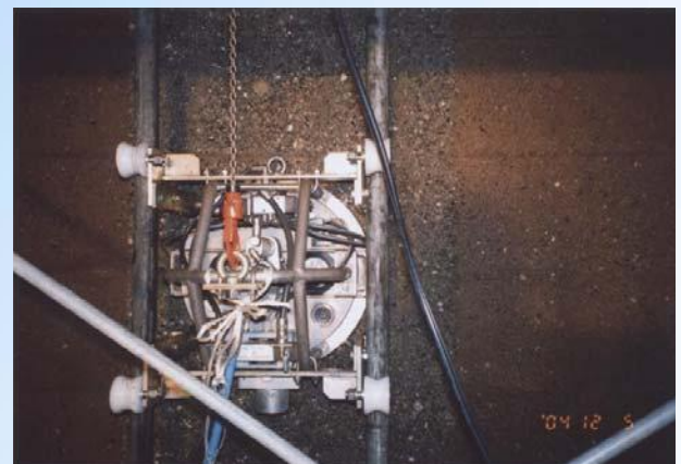
劣化部分除去状況