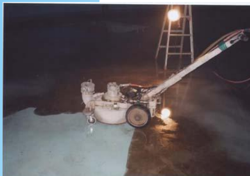
槽内床部 ライニング除去