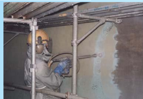
槽内壁部 ライニング除去