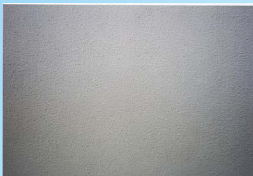
外壁 (リシン吹き塗装)