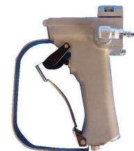
手元スイッチ(トリガー)