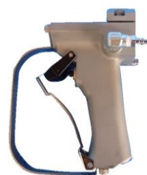
手元スイッチ(トリガー)