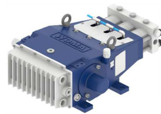
プランジャーポンプ