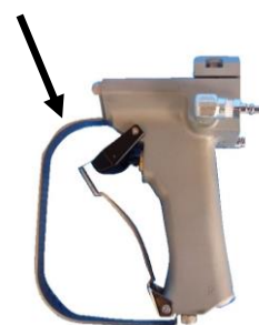
手元スイッチ(トリガー)