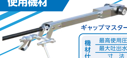
ギャップマスター