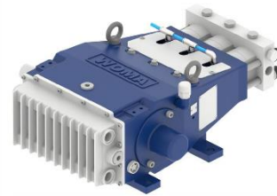
プランジャーポンプ