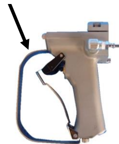
手元スイッチ(トリガー)